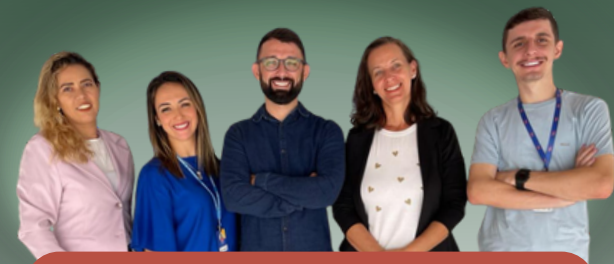
Colegiado do Conselho Tutelar Porto Belo/SC

Investir em um processo estruturado é garantir que os profissionais escolhidos estejam legitimados para exercer uma função essencial na defesa dos direitos de crianças e adolescentes.